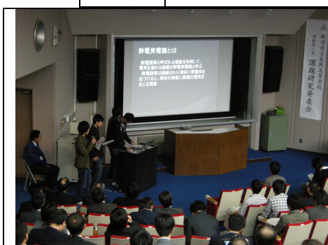
長岡技術科学大学での課題研究発表会