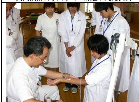
長岡中央総合病院での見学会