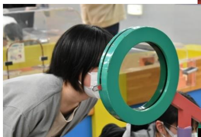
6.7組 自然科学博物館