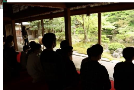
8組 北方文化博物館