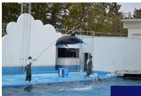
3、5組 マリンピア日本海