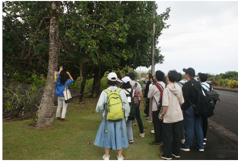
ハワイ固有植物の観察