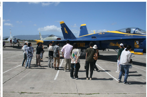
太平洋航空博物館解説