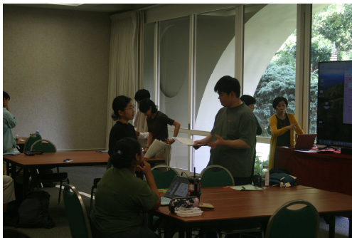
発表前のリハーサル中