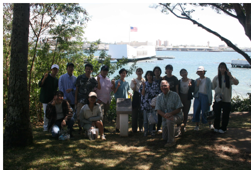
戦後70年長岡ホノルル平和交流記念碑