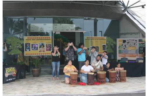
当日はセンター開館18周年のイベントが開催されていました。