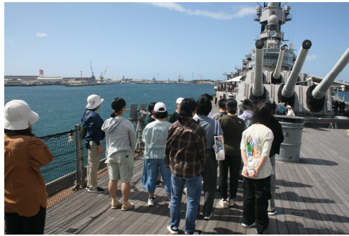
戦艦ミズーリ解説