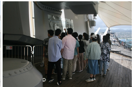
降伏文章調印の解説