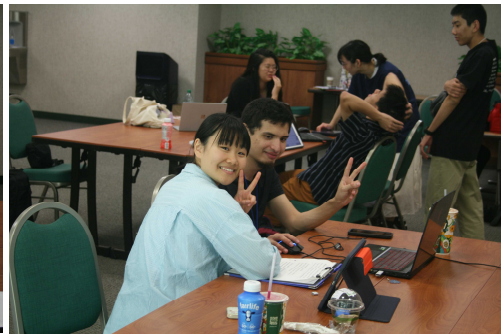
発表資料について指導