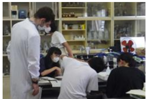
実験を確認するペイトン先生と生徒