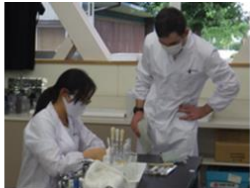
実験中の様子。わからないことがあった生徒は質問していた。