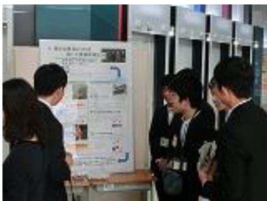
ポスター発表の様子