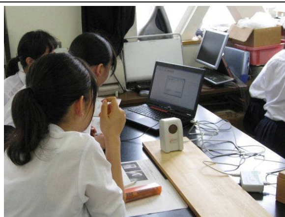
パソコンとセンサー（距離センサー）を用いた物理実験（斜面の物体の運動解析）