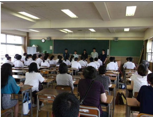
理数科1年生による理数科の紹介、参加者からの質疑応答など