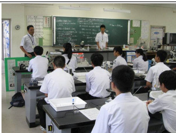
酵母を使って高校生物の授業を知ろう！（酵母の呼吸実験、酵母の観察など）