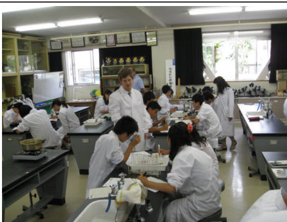
ALTは英語で指導し、生徒は一生懸命実験に取り組んでいます。