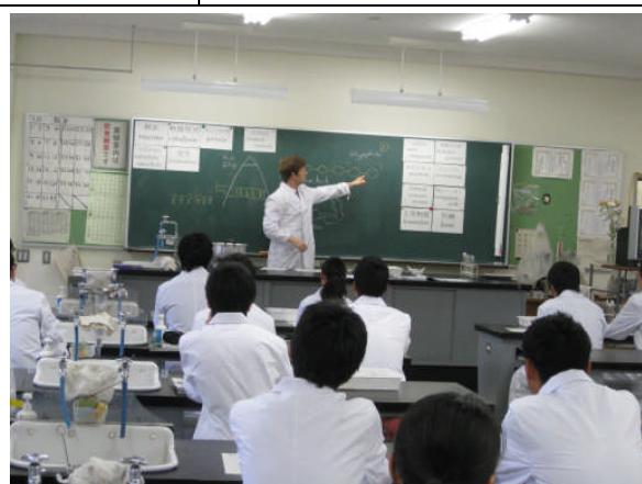
本校ALTが、英語教員・理科教員とともに、英語で理科実験を指導します。