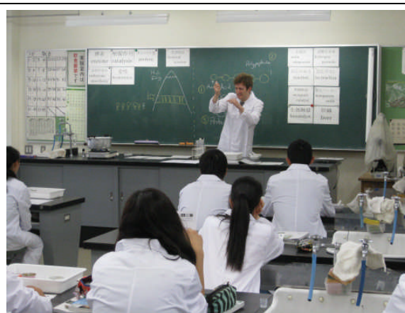
実験器具(ピペット)の使い方の説明。